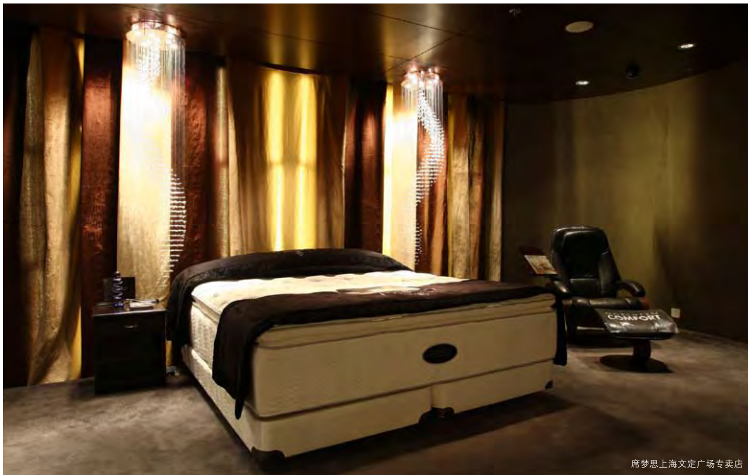
席梦思上海文定广场专卖店