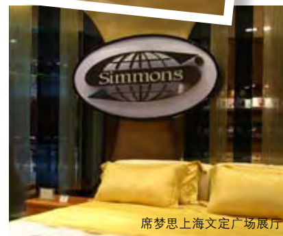
席梦思上海文定广场展厅

www.simmons.cn Enquiry@simmons.cn 服务热线：+8621 6248 2233